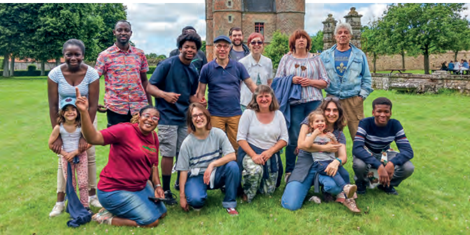
Oben: Gemeindeausflug nach Carrouges; im Hintergrund das Schloss aus dem 14. Jahrhundert

„Von Ökumene 2 halte ich nichts.“ Doch schon mein Antrittsbesuch stellte das infrage. Und es folgten weitere Schlüsselbegegnungen: