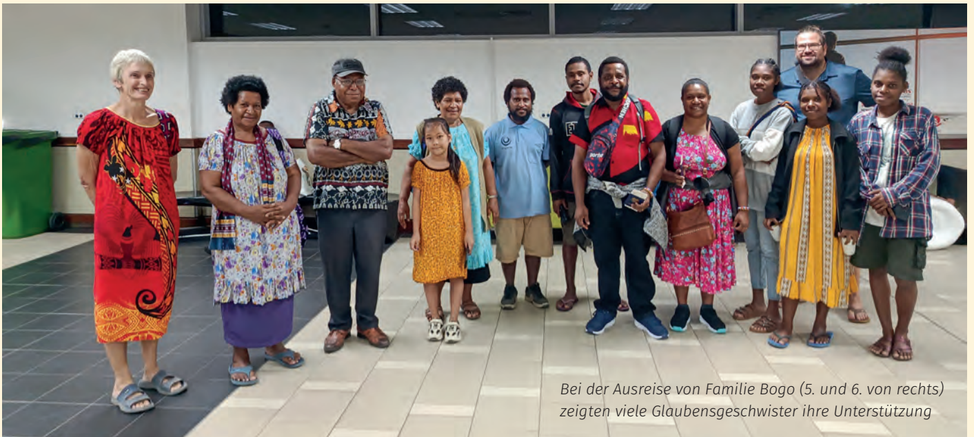
Bei der Ausreise von Familie Bogo (5. und 6. von rechts) zeigten viele Glaubensgeschwister ihre Unterstützung