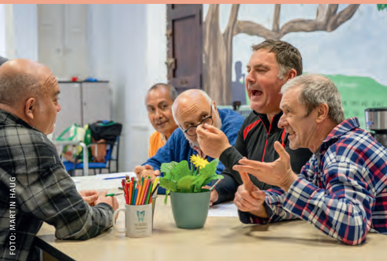
Respektvoll streiten ist möglich

Schrift bezeugt wird, ist das ein Wort Gottes, das wir zu hören, dem wir im Leben und im Sterben zu vertrauen und zu gehorchen haben.“ Aus dieser positiven Bestimmung ergibt sich konsequent das Anathema: „Wir verwerfen die falsche Lehre, als könne und müsse die Kirche als Quelle ihrer Verkündigung außer und neben diesem ein Wort Gottes auch noch andere Ereignisse und Mächte, Gestalten und Wahrheiten als Gottes Offenbarung anerkennen.“ Es geht um die Einzigartigkeit Jesu Christi. Damit ist jedes „WIE“ und jedes „UND“ ausgeschlossen.