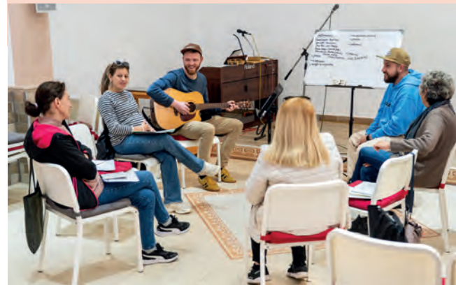
Unten: Glaubenskurse bieten eine gute Möglichkeit für Interessierte, Jesus besser kennenzulernen