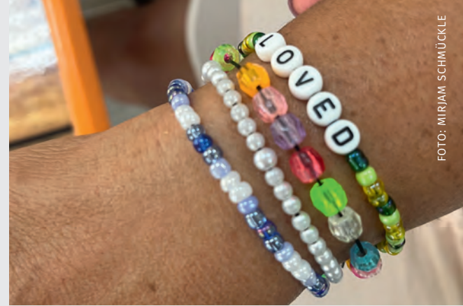
Eine Erinnerung an Gottes grenzenlose Liebe

„Meine Familie nennt mich einen hoffnungslosen Fall.“ Vor mir sitzt eine 48-jährige Ecuadorianerin. Sie ist auf den Straßen Valencias und im Projekt Misión Evangélica Urbana bekannt. Das Team der Stadtmission kümmert sich täglich um rund 80 Menschen, die aufgrund psychischer Erkrankung, Flucht, Gewalterfahrungen oder wegen Drogenabhängigkeit auf der Straße leben. Sie finden liebevolle Zuwendung und Gebet. Es gibt Essen, frische Kleidung, Duschen und Beratung bei der Arbeitssuche. Hier hören Hoffnungslose von Jesus Christus, der jeden liebt, niemanden aufgibt und neue Perspektiven schenkt. Die Ärzte sagen, dass die Frau nur noch wenige Monate zu leben hat, wenn sie weiter Drogen nimmt. Heute ist sie wieder zum Frauentreffen gekommen. Sie ist deutlich von der jahrelangen Sucht geprägt. Dreimal war sie in Rehabilitation,