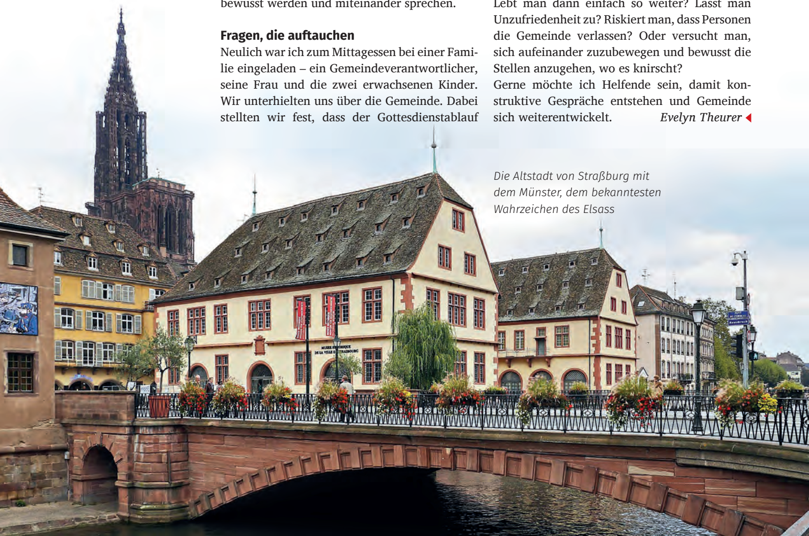
Die Altstadt von Straßburg mit dem Münster, dem bekanntesten Wahrzeichen des Elsass