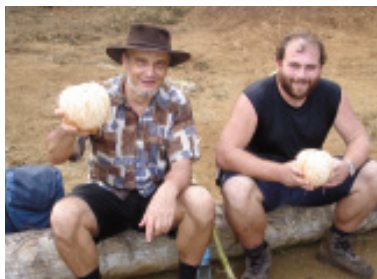
Liebenszeller Missionare in Papua-Neuguinea