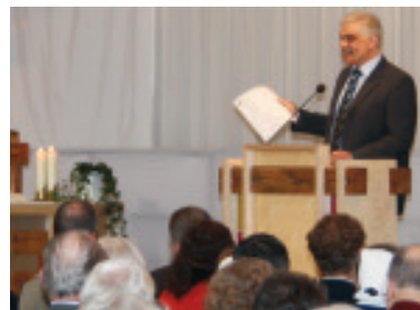
Prediger im Dienst

Er soll, wenn möglich, ein »Allrounder« (Alleskönner) sein: pfiffig in der Jugendarbeit, dynamisch im Gemeindeaufbau, kreativ in der Verkündigung und seelsorgerlich im Umgang mit den Einzelnen. Dieses Bild einer »Eier legenden Wollmilchsau« überfordert viele Pfarrer und Prediger. Viele sehen sich in unserer deutschen Kritikkultur irgendwann selbst mit mehr oder weniger massiven Anfragen konfrontiert – und halten entsprechend Distanz.