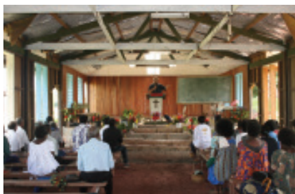
Missionar im Einsatz

Zum Dritten soll und muss er in einer Gemeinde auch ständig integrieren. Überall, in der frömmsten oder liberalsten, der charismatischsten oder anti-