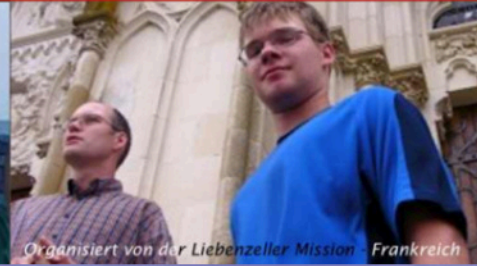
Organisiert von der Liebenzeller Mission - Frankreich

Name: Vorname: männlich weiblich Geburtsdatum (TT/MM/JJ): Adresse: