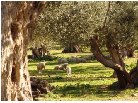
Idylle im Olivenhain

gibt es einen direkten Zugang zu den zwischen ursprünglichen Buchten gelegenen Badezonen, die heute ebenfalls besucht werden. Anschließend geht es von Tropea entlang der malerischen Küstenlandschaft zum Capo Vaticano. Das Mittelmeerkap Kalabriens wird durch seine mediterranen Küstenlandschaften charakterisiert, die einen einzigartigen Blick auf die Straße von Messina und die Äolischen Inseln zulassen. Dort liegt der im Jahr 1870 erbaute weiße Leuchtturm, der das Kap noch heute überblickt. Mit den Eindrücken der traumhaften Landschaften des Capo Vaticano geht es zum Abendessen in das Hotel zurück.