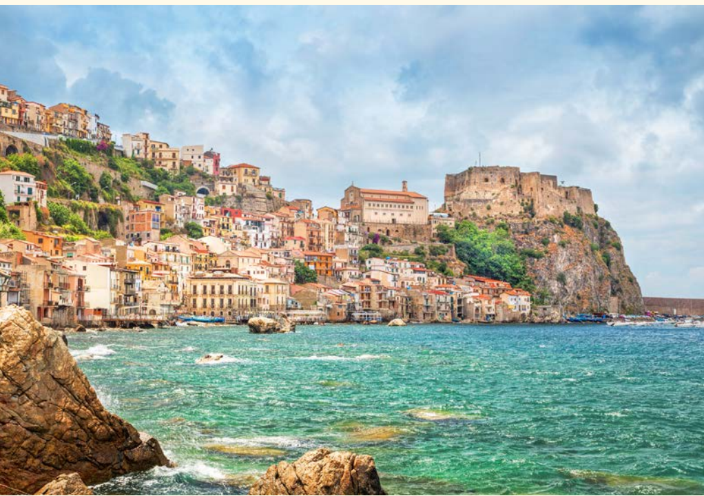
Scilla mit Castello Ruffo