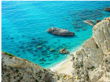
Die kalabrische Küste