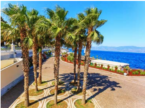
Promenade von Reggio Calabria