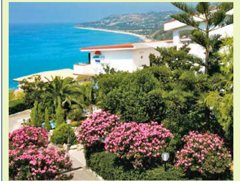
Ausblick vom Hotel Santa Lucia