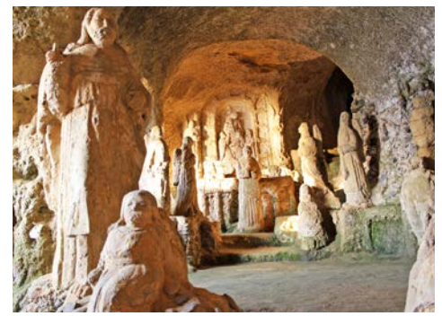
Chiesa di Piedigrotta