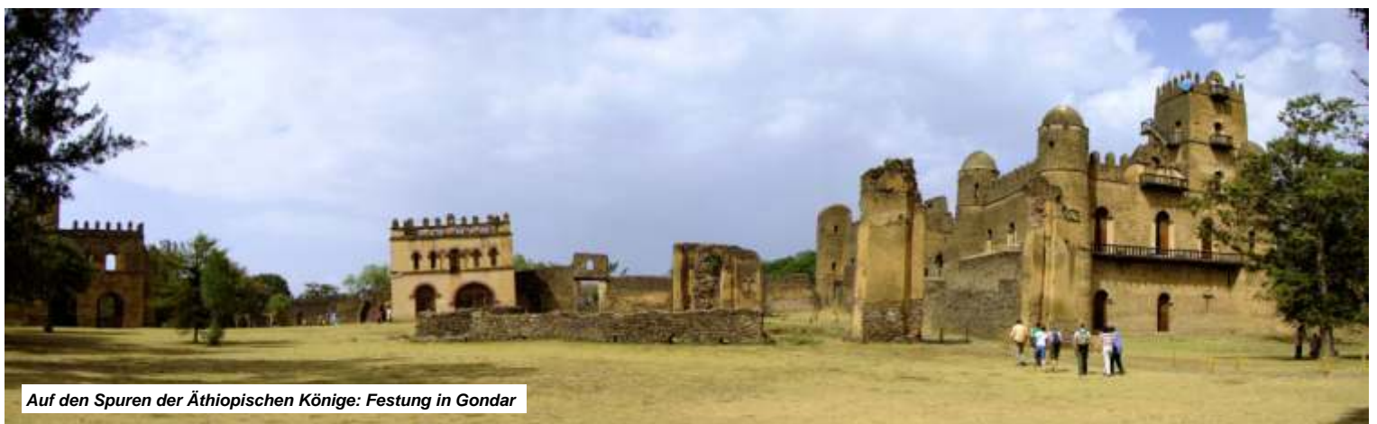
Auf den Spuren der Äthiopischen Könige: Festung in Gondar

Nach dem Mittagessen in Gondar besichtigen wir die Kaiserstadt. Neben der Schlossanlage mit ihrer Befestigungsmauer hat Gondar eine weitere Attraktion, die Debre Berehan Selassie-Kirche (Licht der Dreieinigkeit) mit einer der schönsten Wandmalereien des Landes. Es wird gesagt, dass die Kirche ursprünglich der letzte Aufenthaltsort der heiligen Bundeslade werden sollte. Abendessen und Übernachtung im Hotel in Gondar.