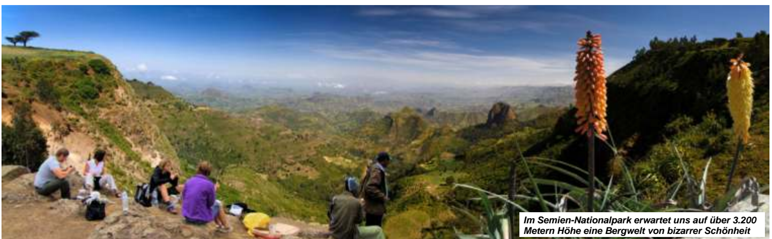
Im Semien-Nationalpark erwartet uns auf über 3.200 Metern Höhe eine Bergwelt von bizarrer Schönheit