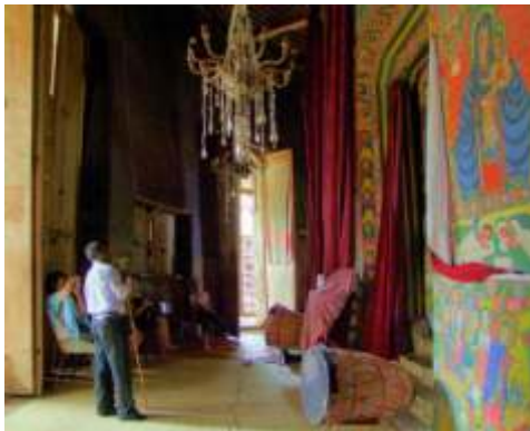
Die Rundkirchen auf den Inseln des Tana Sees bergen kostbare Wandmalereien

Willkommen in Afrika! Ankunft in Addis Abeba gegen 7:15 Uhr, Erledigung der Visa Formalitäten (z.Zt. 20 US$ / 17 Euro). Transfer zum Stadthotel, Zeit zum Frisch machen und Mittagessen. Addis Abeba liegt auf ca. 2.400 m über dem Meeresspiegel an einer der höchsten Stellen der Entoto-Gebirgskette. Nachmittags orientierende Stadtrundfahrt . Neben dem Merkato, dem größten Freiluft-Markt Afrikas, besuchen wir das Nationalmuseum, das uns die Geschichte des Landes näher bringt. Abendessen und Übernachtung im Hotel.