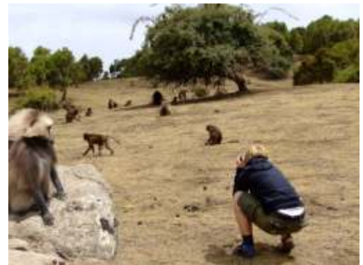
Auf Fotopirsch bei den gesellig lebenden Dschelada-Bergpaviane

Heute begeben wir uns auf den Weg zum nördlichsten Punkt unserer Äthiopien Rundreise, der Stadt Axum. Via der Tekezze Schlucht erreichen wir Axum, den Krönungsort vergangener äthiopischer Kaiser und heilige Stadt äthiopischer Christen. Übernachtung im Hotel.