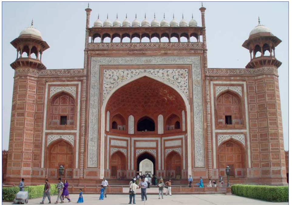
Agra, Taj Mahal Gateway

Schließlich erreichen Sie das in der Nähe von Jaipur gelegene Amber Fort, den ursprünglichen Herrschersitz der Maharajas. Jeeps bringen die Besucher zum Fort des Raja Man Singh, wo mächtige Tore, Höfe, Treppenaufgänge, Säulenpavillons und Spiegelsäle den Ruhm und