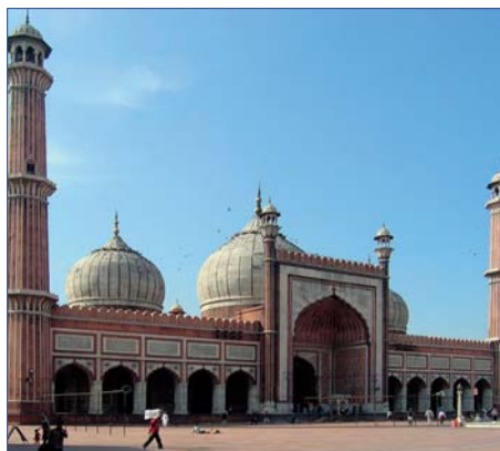
Jama Masjid, Delhi

L assen Sie sich entführen in ein Land voller Faszination! Seit jeher übt der Indische Subkontinent eine magische Anziehungskraft auf viele Reisende aus. Hier ist die Wiege großer Religionen und Kulturen, deren Denken und Handeln auch uns bis heute beeinflusst. Auf unvergleichliche Weise wird in Indien Altes und Neues miteinander verknüpft: Jahrhunderte alte Moralvorstellungen, Bräuche und Traditionen überleben gleichwertig neben modernen Ideen und Technologien. Bei dieser Reise zeigt sich Indien von seiner schönsten Seite. Erleben Sie die Höhepunkte des Goldenen Dreiecks und Rajasthans und lassen Sie sich