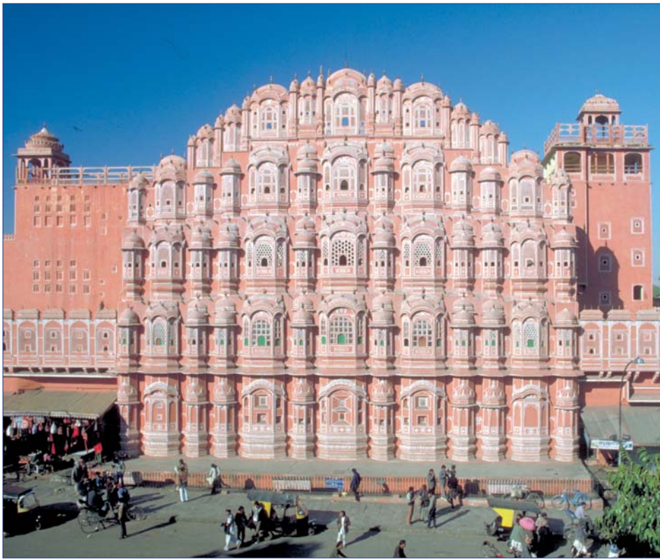
Jaipur, Hawa Mahal – „Palast der Winde“

8. Tag: BIKANER – MANDAWA Heute morgen besichtigen Sie den Stadtpalast, das Junagarh Fort. Der Bau der riesigen Festung wurde 1587 von Raja Rai Singh, einem Zeitgenossen Akbars, begonnen. Erbaut aus gelbem Marmor, außerdem ausgeschmückt mit Spiegel- und Glaseinlagen sowie wunderschönen Wandmalereien, ist das Fort heute einer der am besten erhaltenen Rajputen-Paläste.