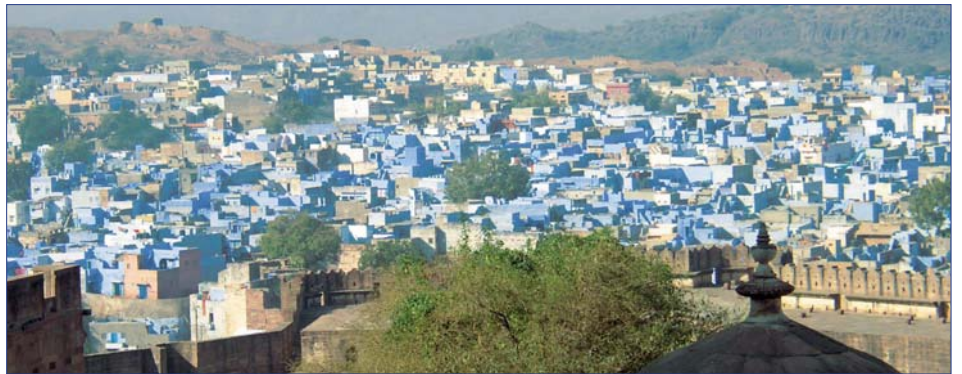
Jodhpur, die „Blaue Stadt“

6. Tag: JAIPUR – JODHPUR – KHEJARLA Morgens Fahrt nach Jodhpur. Im 15. Jahrhundert gründete Rao Jodha die Stadt Jodhpur im Herzen Rajasthans und Tor zur Wüste Thar. 500 Jahre später wurde hier von Maharaja Umaid Singh einer der größten privaten Wohnsitze der Welt