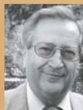
Hermann Decker Freizeit I

Bei unserer Großeltern-Enkel-Freizeit können Sie viele solcher unvergesslicher Momente mit Ihren Enkeln erleben. Kommen Sie gemeinsam zu uns ins Monbachtal. Mit der herrlichen Natur, dem plätschernden Monbach, den vielen Sportangeboten, dem Spielplatz bietet es die allerbesten Voraussetzungen für glückliche Tage! Außerdem haben wir ein buntes Programm für Sie zusammengestellt, wie zum Beispiel das gemeinsame Grillen am Lagerfeuer. Auch geistlich bieten wir Ihnen und Ihren Enkelkindern ein spezielles Programm an.