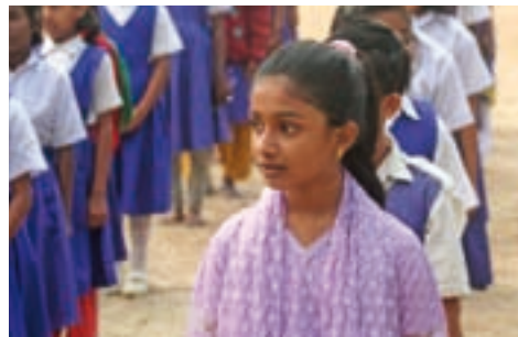
Schulbesuch statt Kinderarbeit

Seit Mitte Januar 2009 können Kinder aus der Stadt Dinajpur eine gute Schulbildung erhalten und mit dem christlichen Glauben bekannt werden. Die bewusst christlich geführte Einrichtung wird von der Liebenzeller Mission finanziell und personell durch die Mitarbeit in der Leitung unterstützt. Nur knapp die Hälfte der 200 aufgenommenen Schüler kommt aus christlich geprägten Familien, die meisten gehören zur religiösen Mehrheit oder sind Hindus. Allen Kindern gemeinsam ist, dass sie aus armen bis sehr armen Familien kommen. Meist arbeiten die Väter als Rikschafahrer oder Tagelöhner, und die Familie lebt von der Hand in den Mund. Bisher besteht die Schule aus einer Vorschule und den Klassen 1 bis 7. Die Klassen-